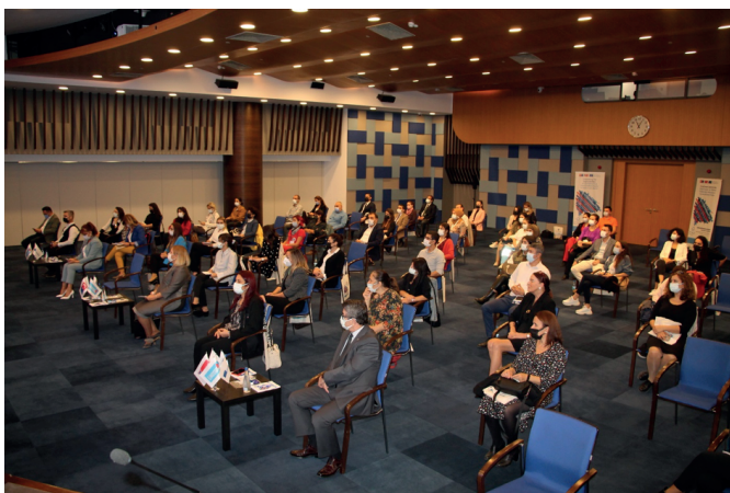
Empower4Employment Konferenz, Erasmus Days, 14. Oktober 2021