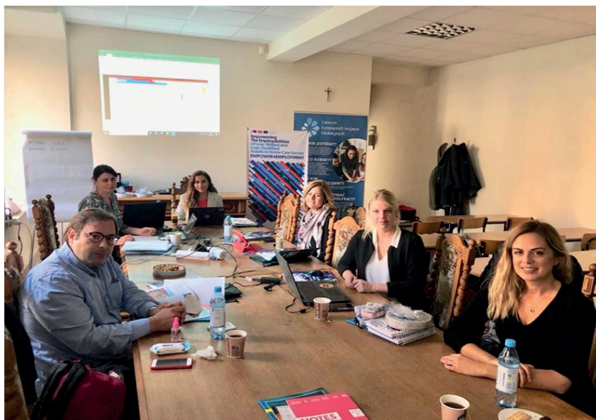
Drugie Międzynarodowe Spotkanie Projektowe, Polska/Łódź, Październik 2021

Wyższa Szkoła Biznesu i Nauk o Zdrowiu (WSBINOZ) w Łodzi gościła partnerów i koordynatora projektu Empowering The Employabilities Of Low Skilled And Low Qualified Adults in Home Care Sector (2019-1-TR01-KA204-076960). To już drugie z rzędu spotkanie partnerskie w ramach tego konsorcjum. Zespół projektowy był bardzo zadowolony z ponownego spotkania, zwłaszcza, że odbyło się ono w fizycznej formie.