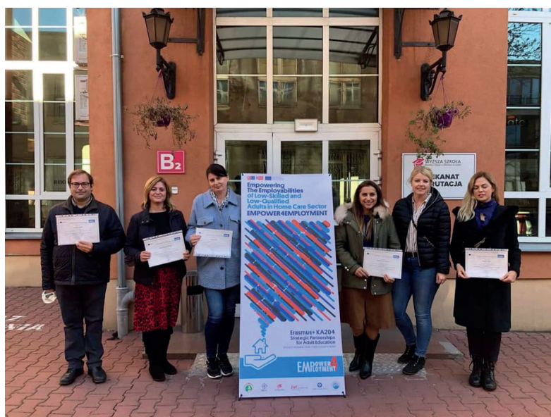
Drugie Międzynarodowe Spotkanie Projektowe, Polska/Łódź, Październik 2021