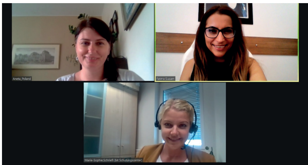
Reunião dos líderes das diretrizes intelectuais, setembro 2021

No âmbito do projecto, são desenvolvidos 3 diretrizes intelectuais. A equipa do projecto completou a estrutura principal de todos os resultados intelectuais e está a fazer as revisões finais. Na reunião realizada em Setembro, os líderes da produção intelectual discutiram a situação mais recente e a compatibilidade dos resultados intelectuais uns com os outros. A 1ª Produção Intelectual, Skill/Competences Determination Handbook, é liderada pelo Governo de Izmir (Turquia), a 2ª Produção Intelectual, Training Curriculum, é liderada por WSBINOZ (Polónia) e a 3ª Produção Intelectual, Job Matching Platform, é liderada pela gestão de bits (Áustria).