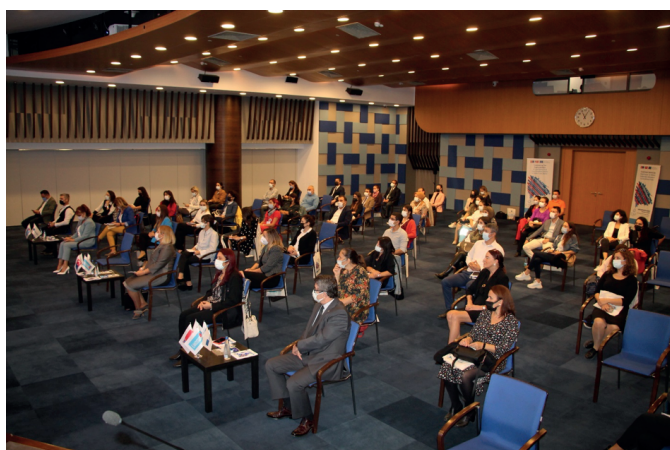
Conferência Empower4Employment, Jornadas Erasmus, 14 de outubro 2021