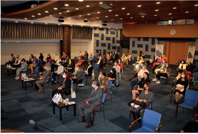
Erasmus Günleri Empower4Employment Konferansı, 14 Ekim 2021