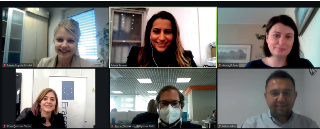
Çevrimiçi Proje Kurulu Toplantısı, Kasım 2021

Empower4Employment ekibi proje başlangıcından bu yana ayda bir kez çevrimiçi olarak toplanmaktadır. Projenin düzgün bir şekilde yürütölmesini sağlamak amacıyla düzenli olarak çevrimiçi proje kurulu toplantıları yapılmıştır.