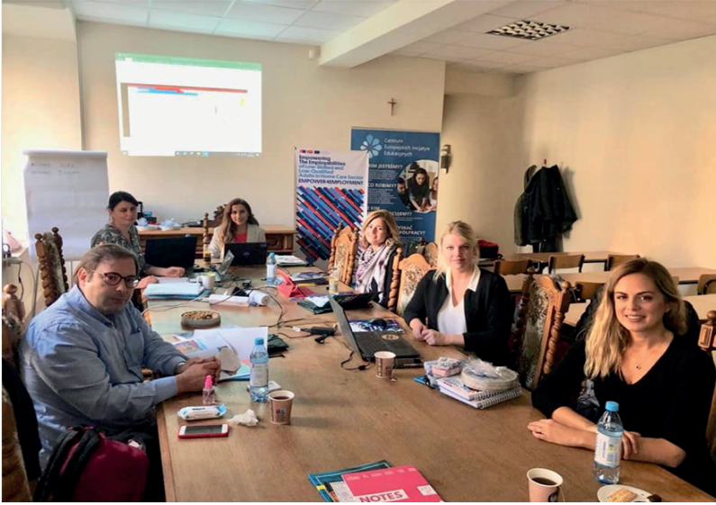
2. Ulusötesi Proje Toplantısı, Polonya/Lodz, Ekim 2021

Bu toplantı, proje ekibinin ikinci ortaklık toplantısıdır. Proje ekibi tekrar bir araya gelmekten ve toplantıyı fiziki olarak gerçekleştirmekten memnuniyet duymaktadır.