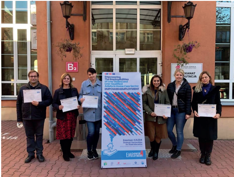
2. Ulusötesi Proje Toplantısı, Polonya/Lodz, Ekim 2021