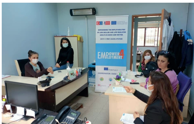
Spotkanie i wywiady z pracownikami służby zdrowia w Centrum Zdrowia w Çiğli, które jest odpowiedzialne za opiekę domową i usługi zdrowotne, 14 kwietnia 2021 r.