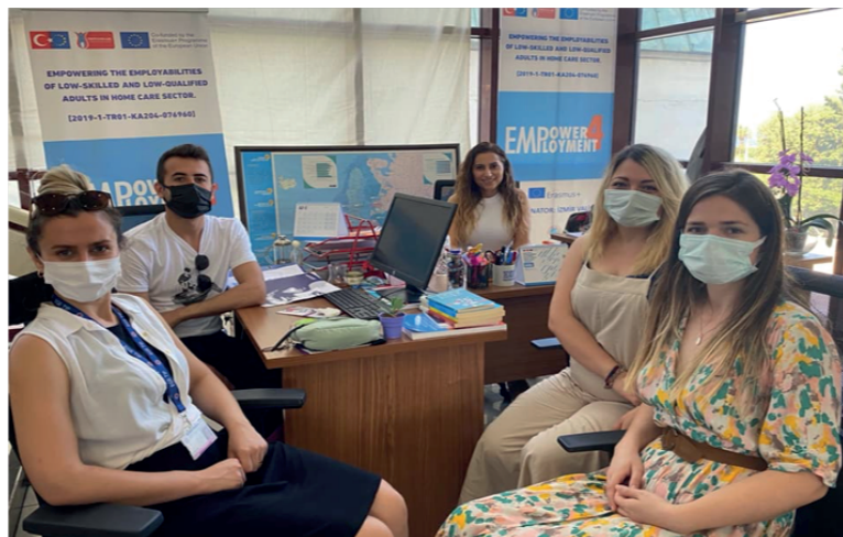
Poinformowanie o projekcie na spotkaniu z doktorantami wydziału zdrowia publicznego Ege University Health Science Institute w ramach ich programu doktoranckiego, 30 czerwca 2021