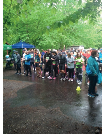
Prezentacja projektu i dystrybucja materiałów promocyjnych podczas charytatywnego wydarzenia "Bieg dla Tosi" w Łodzi, 22 maja 2021 r.