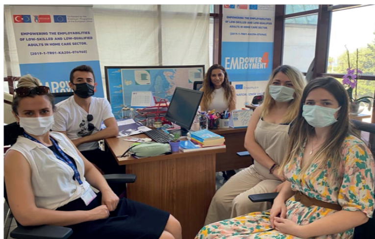
Informar sobre o projecto na reunião com estudantes de doutoramento do departamento de saúde pública do Ege University Health Science Institute, como parte do seu programa de doutoramento, 30 de junho 2021