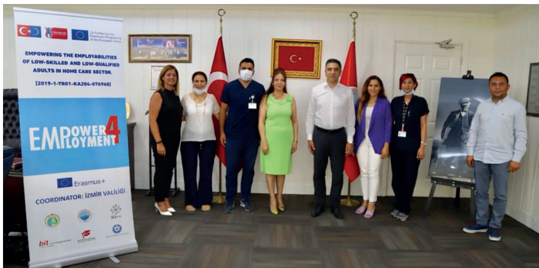
Reunião de avaliação com a equipa de saúde e cuidados domiciliários, 29 de junho 2021

O Projecto Empower4Employment tem sido apresentado em muitos eventos internacionais e nacionais por parceiros do projecto. Alguns exemplos disso;