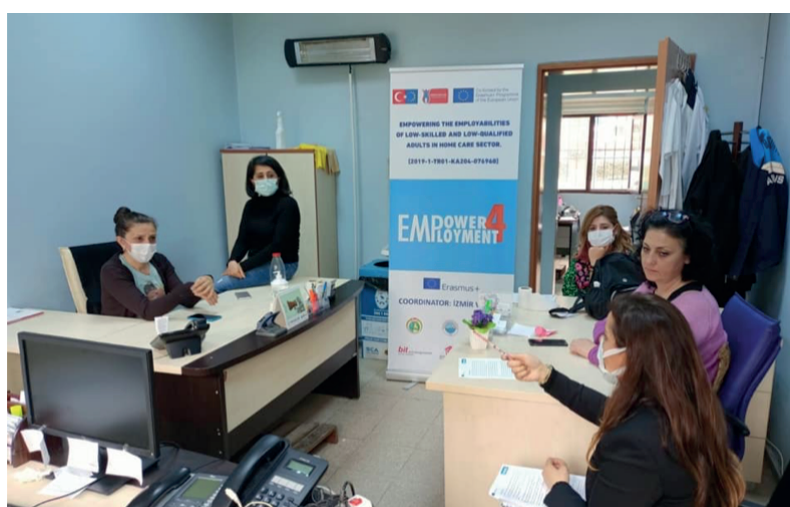
Reunião e entrevistas com profissionais de saúde em Çiğli Centro de Saúde que é responsável pelos Cuidados ao Domicílio e Serviços de Saúde, 14 de abril 2021