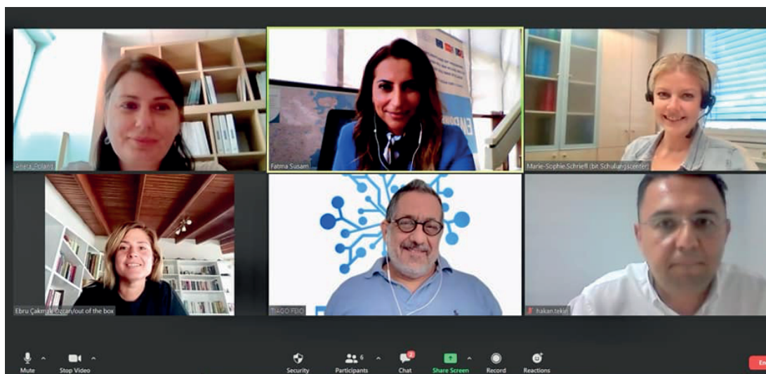
Reunião Online entre parceiros, junho 2021

• A equipa Empower4Employment tem vindo a reunir-se mensalmente em linha desde o início do projecto. Como toda a equipa do projecto, estamos ansiosos por nos reunirmos de novo frente a frente.