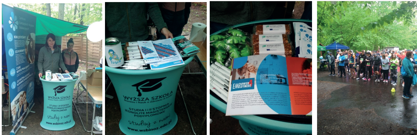
Apresentação do projecto e distribuição do material de divulgação em Run for Tosia Event em Lodz, 22 de março 2021