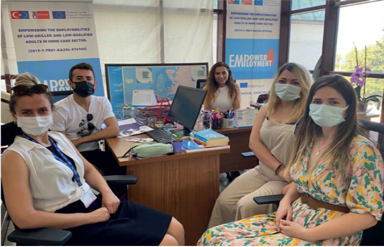
Ege Üniversitesi Sağlık Bilimleri Fakültesi, Halk Sağlığı bölümü doktora öğrencilerine doktora programları doğrultusunda proje tanıtım toplantısı, 30 Haziran 2021