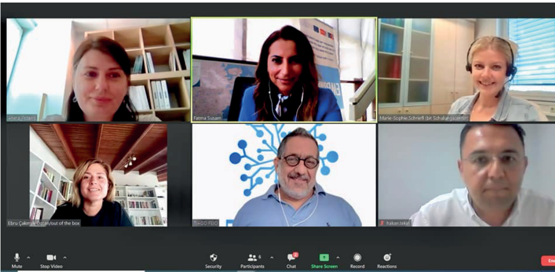
Çevrimiçi Proje Yönetim Kurulu Toplantısı, Haziran 2021