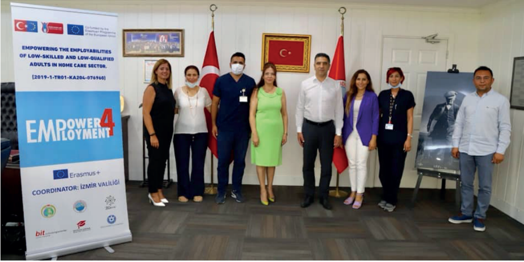
Evde Bakım ve Sağlık Ekibi ile Değerlendirme Toplantısı, 29 Haziran 2021

Empower4Employment projesi, proje ortakları tarafından birçok ulusal ve uluslararası etkinlikte sunulmuştur. Aşağıda bazı örnekleri verilmiştir;