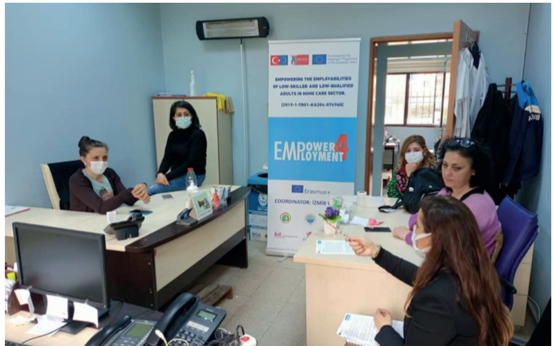
Çiğli Halk Sağlığı Merkezi Evde Bakım ve Sağlık Birimi çalışanları ile buluşma ve görüşmeler, 14 Nisan 2021