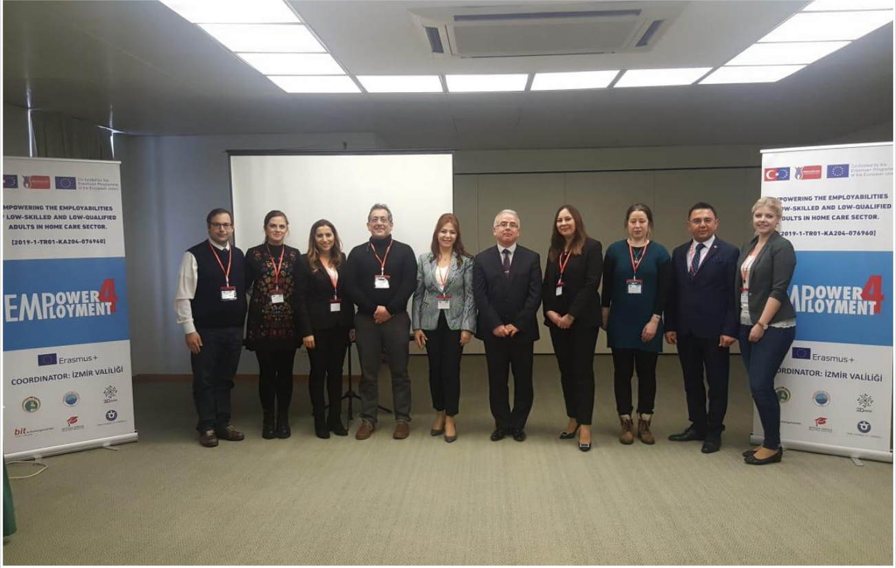
EMPOWER4EMPLOYMENT Projesinin Başlangıç Toplantısı (16-17 Ocak 2020, Portekiz)